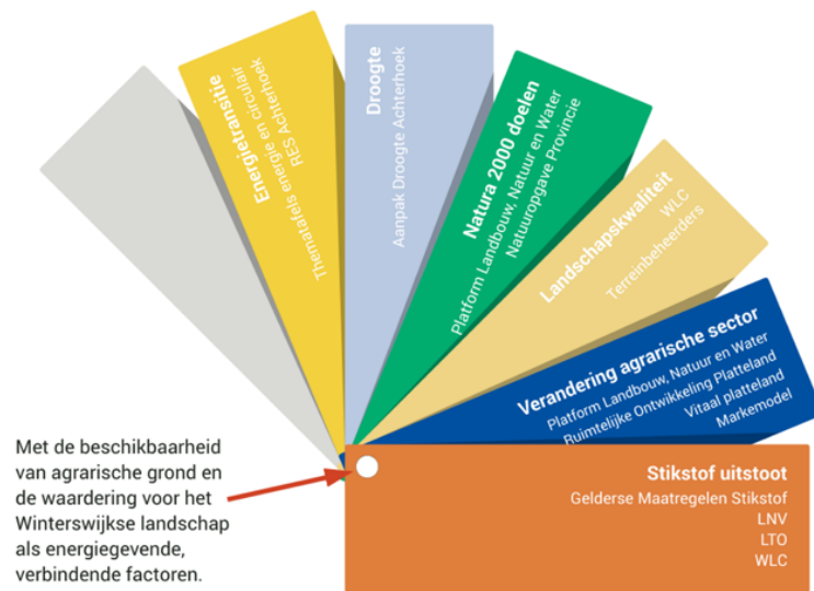
Opgaven uit de pré-verkenning